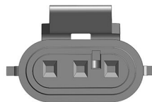
Figura 1. 12-171-02 – Cableado externo