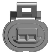
Figura 1. 12-166-01 – Cableado externo