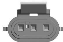
Figura 1. 12-169-02 – Cableado externo